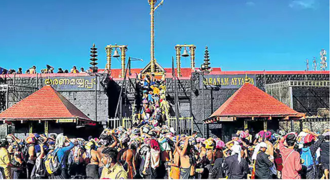
త్రర్నల్లో తనకు వ్యతిరేకంగా ఉన్న తీవ్ర వ్యాఖ్యలను తొలగించాలని కోరుతూ తాజాగా అతడు సుప్రీంకోర్టు ను ఆశ్రయించారు. అయితే న్యాయస్థానం ఆ పిటిషన్ ను తోసిపుచ్చింది. ఇక ఈ కేసులో దర్యాప్తు పూర్తిచేయడానికి సీట్ కు కేరళ హైకోర్టు ( మరో ఆరువారాల గడువు ఇచ్చింది. జనవరి 19న ప్రత్యేక దర్యాప్తు బృందం మధ్యంతర నివేదికను న్యాయస్థానానికి సమర్పించనుంది.